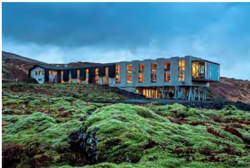
PLEASURE ISLAND —De cima para baixo, área da piscina do Ion; vista externa do hotel; uma das criações da Design March 2013; a capital, Reykjavík